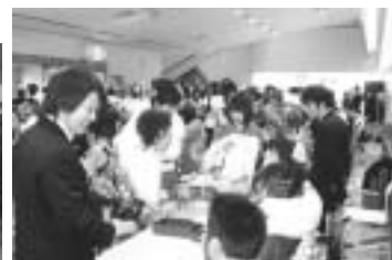
ロビーでの受付の様子