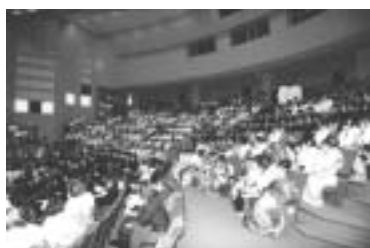
式典会場の文化会館大ホール

問い合わせ先 生涯学習課 学推進係(内線523)ファクス 42大板井1180番地1生涯 学習センター内)