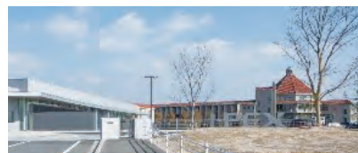
大学跡地を活用したI-PEXキャンパス