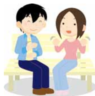
手話言語条例を制定し共生社会の実現を！