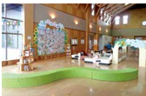
こども広場「ことこと」