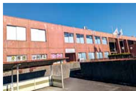
工事期間中、市民利用の規制が予想される市体育館