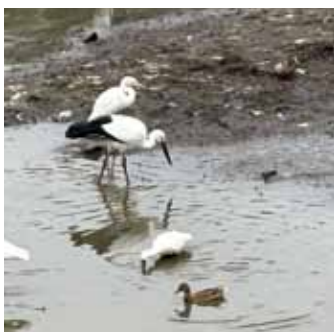
すべての野鳥がいなくなった