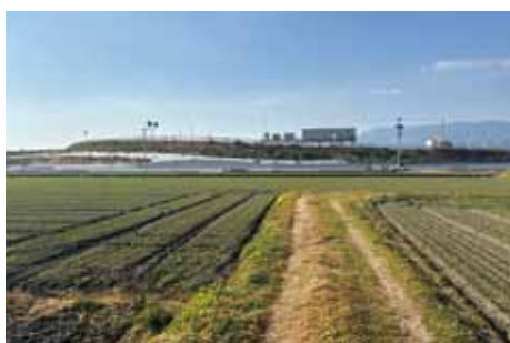
福童地区が耕作者のいない農地にならない開発を。