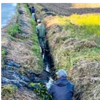
集落組織の共同活動