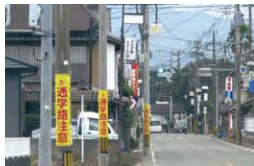
市道30号線（注意喚起）看板

部長 出口2箇所、入口2箇所が設置され、コストコにより安全面への配慮から場内に平日3人、土日6人程度交通誘導員が配置されている。また、広域でも配置