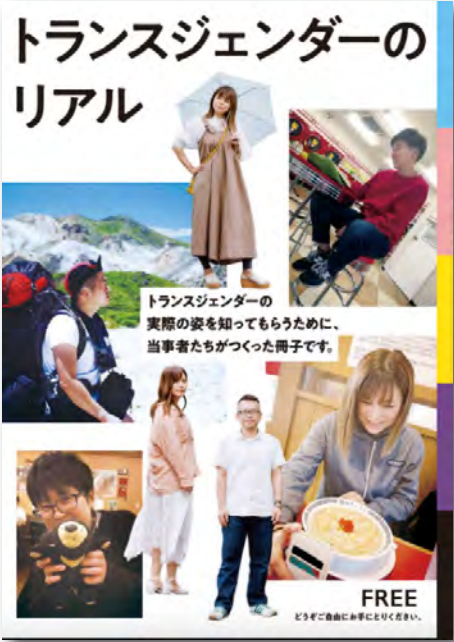
トランスジェンダーの実際の姿を知ってもらうために、当事者たちがつづった冊子です。

実際の姿を知ってほしい… 身体が男だから男、女だから女。世の中にはそう答える人もいれば、違う答えをもつ人もいます。よくわからない、決められない、単純に答えることが難しいと感じる人もいます。 出生時にわりあてられた性別とは異なるジェンダー・アイデンティティ(自分はどのような性別である/ないという連続した意識のありよう)をもつ人を「トランスジェンダー」といいます。