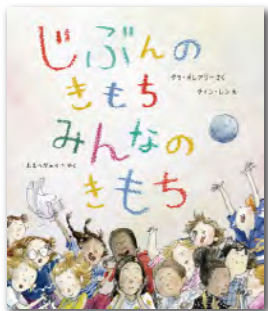
【あかね書房】 サラ・オレアリー さく/ティン・レン え/おおつかのりこ やく

転校してきた初日、周りの子たちは質問をします。 「きみは おんなのこ? おとこのこ?」 その答えは…「どつちでもいいじゃん!」 するといろんな子が集まってきた、自分がきかれたくないこと、きいてほしいことをつぎつぎと話しだします。 みんな自分のことを知ってほしいんですね。