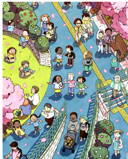
【参照：公益社団法人 アムネスティ・インターナショナル日本】

人には、ある国の国民になる権利があり、またよその国の国民になる権利もあります。その権利を好きかってにとりあげられることはありません。