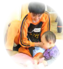
あか 赤ちゃん ふれあい体験

だれかと話したり、隣にいて もらったりすると心が軽くなります。 あたたかいつながりを つくりましょう。