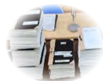
きょういくじょうけんせいび 教育条件整備 の取組

この“まち”に暮らす わたしたちの困っていること、 おも思っていることから、できる ことを考えていきましょう。