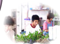
しよくば 職場体験