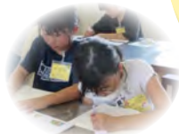
まな ぼ し えん じ ぎょう 学び場支援事業